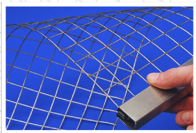
FlexNet, Typ 25